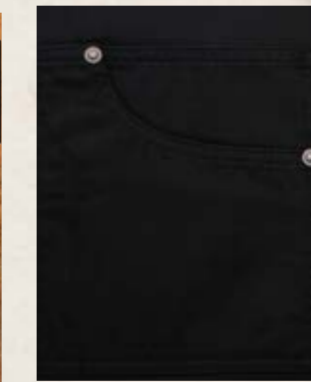
JEANS STYLE LOMME