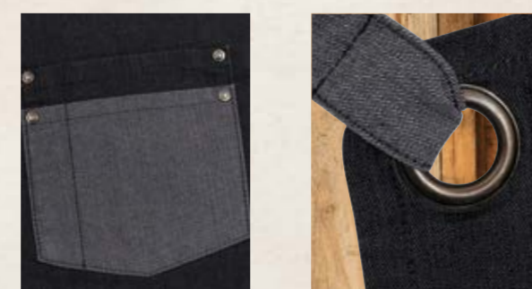
KONTRASTLomme KONTRASTKNYTING OG MALJE