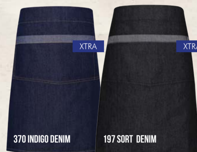
370 INDIGO DENIM